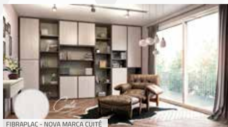
FIBRAPLAC - NOVA MARCA CUITÉ

Alinhada às realizações de seus parceiros e clientes, a Fibraplac apresentou sua nova marca na ForMóvil 2018. A feira também recebeu oito lançamentos da empresa, com padrões que vão do rústico ao elegante, do ousado ao tradicional revisitado. O Cuité destaca-se pela sensação de conforto e tranquilidade que confere ao ambiente. Inspirado na simplicidade e em elementos da natureza, o padrão remete a uma noqueira de aparência suave, ilustrando perfeitamente a leveza do contemporâneo estilo escandinavo. O Cuité faz parte da Linha Reserva da Fibraplac , na qual os detalhes destacam produtos repletos de conteúdo.