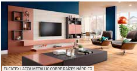
EUCATEX LACCA METALLIC COBRE RAÍZES NÁRDICO

novidades em cores e padrões do Lacca AD, lançamentos da Eucatex em painéis MDF e MDP para a Feira. A inspiração para as novas coleções parte de um olhar criterioso para o design de superfícies e foi pensada com a capacidade de reproduzir superfícies cada vez mais próximas ao natural, entendendo como necessário fazer o design hoje com o pensamento no amanhã, olhando para os recursos naturais e buscando um futuro mais sustentável, levando em conta o ciclo de vida dos produtos.