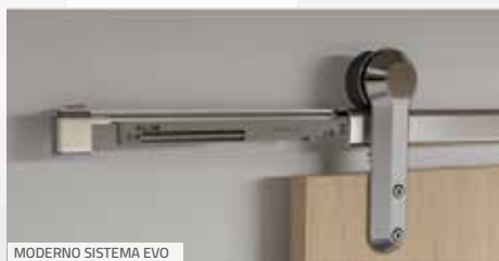
MODERNO SISTEMA EVO

O sistema EVO vem para trazer mais elegância para projetos com portas deslizantes com sistema aparente. Com um design arrojado, o EVO possui um visual contemporâneo e acabamentos que valorizam ainda mais o produto. Conta ainda com tecnologia de amortecimento (Comfort 240), que torna o uso mais confortável e silencioso. O sistema está disponível em 4 cores para combinar com diversos tipos de portas e decoração: Cromado, Champagne, Black Matte e Titanium.