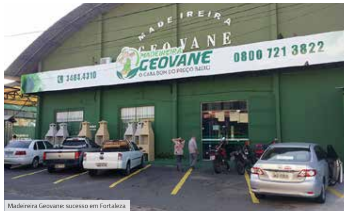
Madeiraira Geovane: sucesso em Fortaleza

Para saber mais, acesse simnegocios.com.br/explosaodepremios Promoção válida de 17/9/2018 a 30/11/2018.