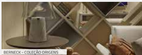
BERNECK - COLEÇÃO ORIGENS

A personalização dos ambientes e a aposta nos painéis de madeira como elemento principal de móveis e interiores marcam os lançamentos da Berneck . A nova coleção de painéis, denominada Origens, trouxe sete novas melaminas BP: Ceramik, Chumbo, Cinamomo, Galiano, Marquina, Millennial e Panamá. Os lançamentos estão disponíveis em painéis MDF, MDP e HDF. O desenho, a textura e a tonalidade de cada novo revestimento foram estudados para garantir móveis e projetos personalizados e ricos em detalhes. A gama de combinações de padrões madeirados, unicolors, fantasia e híbridos traz uma versatilidade aos projetos de interiores e comerciais. É um portfólio de melaminas BP e painéis para ser explorado de diversas formas por industriais, arquitetos, designers e marceneiros. Eles podem atuar sozinhos ou em combinações (móveis + parede + teto).