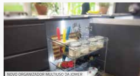
NOVO ORGANIZADOR MULTIUSO DA JOMER

Vencedora do prêmio Top Móbile, a Schmitt traz um design moderno, deixando a linha bastante contemporânea. Com os produtos da linha Slim, o cliente consegue agregar valor ao móvel, baixando o custo, sendo que essa linha é mais econômica em comparação com a linha Classic.