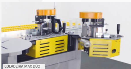
COLADEIRA MAX DUO

A Verry aproveitou a Formóbile para lançar a MAX DUO, uma Coladeira manual que dispõe de 2 coleiros. A seleção de cada um é fácil, segura, rápida e permite o trabalho com diferentes tipos/cores de cola, gerando economia de tempo e espaço com maior produtividade. Possui mesa grande, que permite uso peças de tamanhos variados e estrutura de pés fixos, gerando a robustez necessária para um maior volume de trabalho.