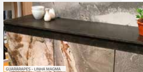
GUARARAPES - LINHA MAGMA

efeito tridimensional e padrões que inovam e enriquecem qualquer projeto.