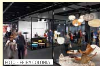
FOTO - FEIRA COLÔNIA