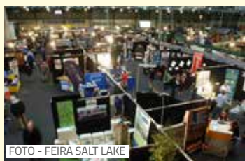
FOTO - FEIRA SALT LAKE

Selecionamos 10 importantes feiras voltadas ao setor moveleiro espalhadas pelo mundo e que ocorrerão no primeiro semestre do próximo ano. Uma excelente oportunidade para conciliar uma viagem de negócios e lazer. Além de ficar por dentro das novas tendências internacionais, você tem a possibilidade de visitar lugares lindos e conhecer novas culturas!