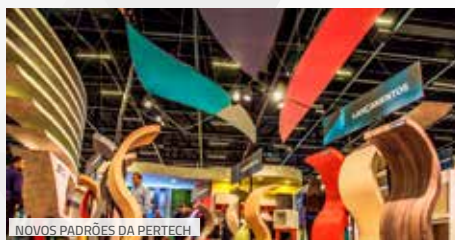
NOVOS PADRÕES DA PERTECH

ganha mais quatro cores. Outras seis diferentes tonalidades de madeirados, com desenhos inovadores, chamaram bastante atenção, em especial pela nova textura, Ultra PORO, que garante bastante proximidade ao aspecto natural da madeira, ao visual e ao toque do laminado. Entre os unicolores, dois novos tons bastante clean completam a gama de cores disponível nessas tonalidades, além de uma nova tonalidade de vermelho. Para fechar, um padrão metalizado, totalmente alinhado às tendências mundiais de decoração, o Rose Gold.