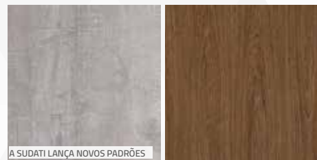
A SUDATI LANÇA NOVOS PADRÕES

A Sudati promoveu o lançamento de cinco padrões de MDF na Feira: ARINTO, onde o concreto, o couro, a madeira e o tecido se fundem para formar uma superfície distinta e elegante; CHENIN BLANC, padrão que possui a leveza e o frescor das cores claras e das madeiras naturais; GLAMOUR, unicolor com um toque especial, tonalidade que entra na gama dos tons neutros, com cor contemporânea e urbana e um leve e delicado brilho; LOURO FREIJÓ, madeira clássica brasileira com características e detalhes que a tornam única, atemporal, e que trazem um ar vintage aos ambientes; e NERELLO, madeirado preto, desenho com uma estrutura que lembra uma versão moderna e linheira do mogno ou sucupira, é exótico e bem comportado, constante e versátil.