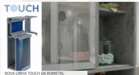
NOVA LINHA TOUCH DA ROMETAL

Com o foco em minimalismo, segurança e conforto, a Rometal destaca a Linha Touch, que possui ranhuras facilitando a pega. Os perfis desta linha têm encaixe para a fita de borda ou tecido, permitindo ainda mais a customização dos projetos. Além de seus diferenciais estéticos, a linha possui os mesmos modelos de perfis para aplicação em madeira ou vidro, o que faz dela uma excelente opção para móveis de alto padrão.