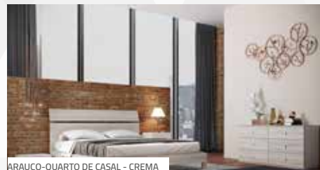
ARAUCO-QUARTO DE CASAL - CREMA

A Arauco aproveitou a ForMóBILE para apresentar o seu segundo lançamento no ano, Infinitas Sensações. A proposta é demonstrar as infinitas sensações visuais e táteis despertadas pelo blend entre os padrões Arauco & Masisa . Há literalmente milhares de combinações harmônicas, desde as mais sofisticadas até as mais ousadas e isto é possível graças ao amplo e atualizado espectro de acabamentos, desenhos e cores do portfólio.