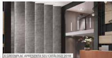
A GREENPLAC APRESENTA SEU CATÁLOGO 2018

A GreenPlac chegou à ForMóvil apresentando em seu estande quatro novas linhas de MDF: Essenziale, que valoriza o simples, incorpora tendências e destaca o belo com uma textura premiada; Toccare, com textura de toque suave, que remete à trama do tecido; Moderno, acompanhando o conceito e o uso de materiais inovadores e estimulando a imaginação do consumidor; e Natural, a essência da sofisticação unida ao desenho da madeira clássica, com textura e poros leves.