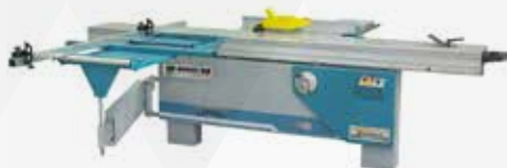
BALDAN - SERRA SE3200-38

Durante a ForMóbile 2018, entre os diversos maquinários expostos, a Baldan destacou a Serra Esquadrejadeira SE-3200/38, produto de fabricação nacional, tendo como componente importado apenas o carro de alumínio. Uma máquina robusta, precisa e com excelente acabamento no corte, mesa móvel em alumínio com roldanas que deslizam sobre guias de aço temperadas e retificadas, que permitem um deslizamento macio do carro e maior durabilidade do conjunto.