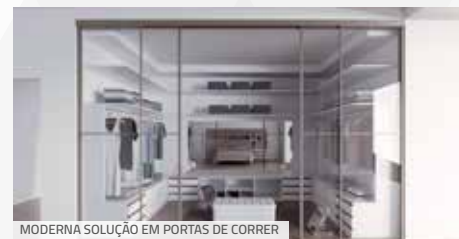
MODERNA SOLUÇÃO EM PORTAS DE CORRER

A Alternativa promoveu diversos lançamentos para as linhas de perfis e sistemas para porta de correr durante a Feira, com destaque para o lançamento do sistema AL86 com amortecimento. Indicado para portas divisórias de ambientes que buscam sistemas suspensos com alta performance, suavidade e amortecimento, este novo sistema apresenta um exclusivo rolamento que proporciona acionamento suave e silencioso.