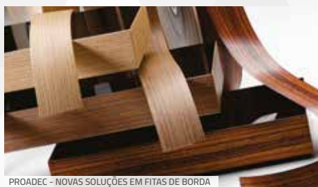
PROADEC – NOVAS SOLUÇÕES EM FITAS DE BORDA

Com uma linha de fitas de borda disponível em diversos padrões, espessuras e larguras, a Proadec apresentou, durante a ForMóvil, novos padrões de fitas de borda em linha com os lançamentos dos fabricantes de Painéis. Para atender esta tendência, a empresa desenvolveu duas soluções em fitas, as linhas ProFoil e ProAlu, que possuem efeito metálico. Disponíveis em 1mm, estas fitas metálicas de tons dourado e prateado, quando aplicadas em painéis com padrão madeirado ou mesmo um unicolor diferente, dão uma sensação de luminosidade e sofisticação ao ambiente.