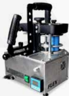
COLADEIRA DE BORDA MAKSIWA CBC FLEX

Possui painel digital e velocidade de avanço, o que permite ao operador escolher a velocidade que deseja para a realização dos seus trabalhos.