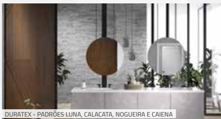
DURATEX - PADRÕES LUNA, CALACATA, NOGUEIRA E CAIENA

Inspirada por quatro estilos que refletem as histórias, referências e valores das pessoas (minimalista, urbano, consciente e criativo) a Duratex lançou na 8ª edição da ForMóvil doze novos padrões de painéis de madeira que passam a fazer parte da Coleção Viva. Os novos modelos, assim como toda a coleção, traduzem e evidenciam as características mais marcantes de cada personalidade e fazem um convite para que as pessoas expressem sua individualidade e vivenciem suas experiências através das soluções propostas.