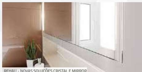
REHAU – NOVAS SOLUÇÕES CRISTAL E MIRROR

A REHAU apresentou o lançamento de diversas fitas de borda e linhas de acabamento. O grande destaque ficou por conta dos lançamentos da já consagrada linha de superfícies RAUVISIO, um componente de estilo único que pode ser aplicado em portas de móveis ou ainda como revestimento de parede. Na ForMóvil, a REHAU ainda levou dois novos produtos que passam a compor a gama de RAUVISIO Crystal: o RAUVISIO Crystal Mirror e o RAUVISIO Cristal Nebbia.